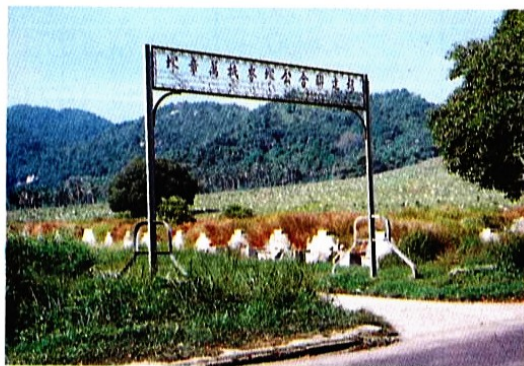
峇都蘭章公塚山後之廿六公司地段 現已改為峇都蘭章公塚(二)